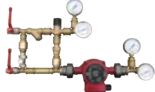
RMG p. 148